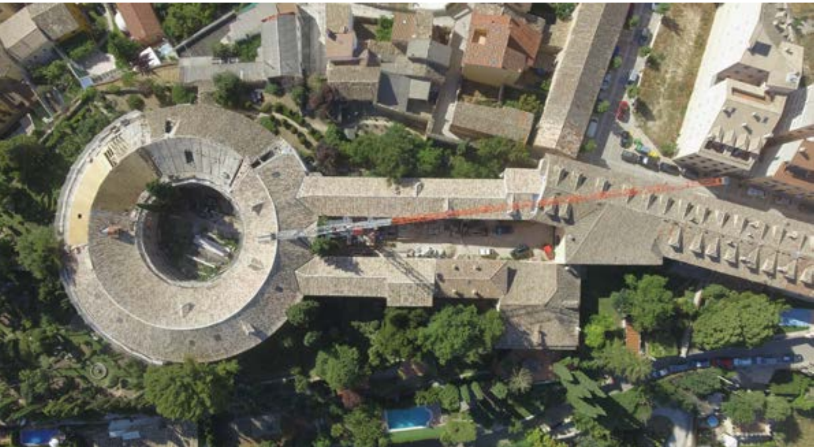
Aerial view of the Cloth Factory during the restoration works of the main building roofs | Imagen aérea de la Fábrica de Paños durante las obras de restauración de las cubiertas del edificio principal | Imagem aérea da Fábrica de Paños durante as obras de restauração das coberturas do edifício principal (Luis Fernando Abril)

The Cloth Factory ensemble is composed of several buildings. The main one is the Rotonda, which has a circular floor plan. Two functional linear elements branch out from it, the press and dyeing lines. This arrangement creates an ensemble structured around two interior patios: a rectangular one and a circular one. Around the latter, the Rotonda building is composed by masonry ring-shaped walls with a thickness of 1.60 m at the base, and a central structural ring made up by Alcarria stone pilasters at the lower floor that support a stone arcade. On the next floor, the structure of this central ring is lighter and the pilasters become stone pillars that support double timber beams. Finally the roof structure, also of wood, consists of a radial truss resting on pillars, each formed by an upright with struts on either side.