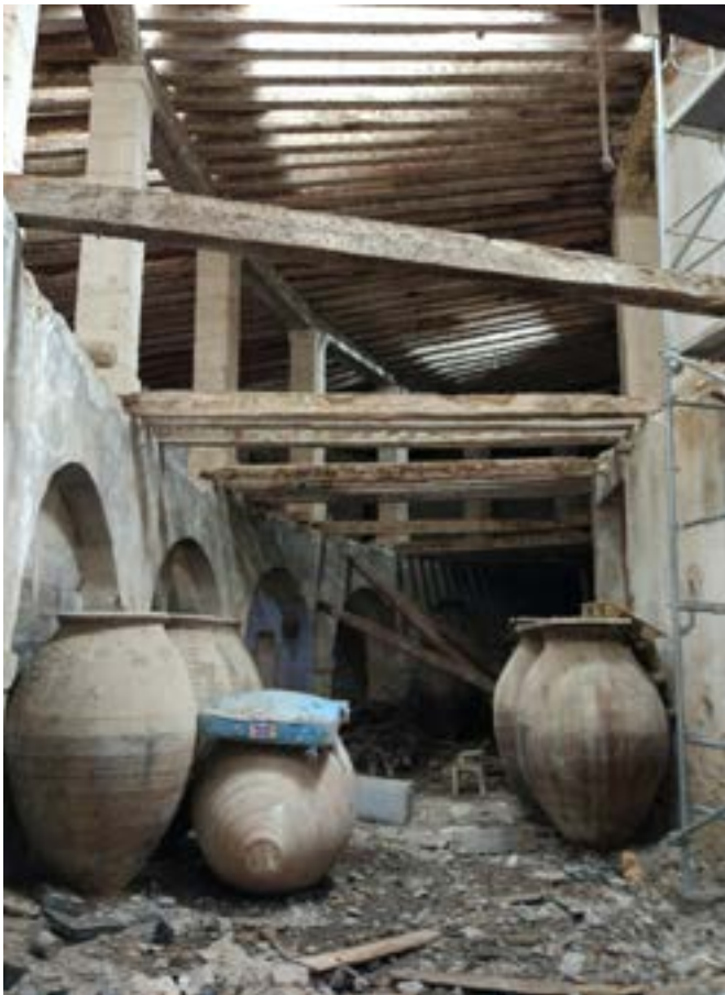
1: State of conservation of the interior of the ground floor before the intervention 2: Recovery of the old ground floor flooring, recovery of the closed openings and new arrangement of the jars | 1: Estado de conservación del interior de la planta baja previo a la intervención 2: Recuperación del antiguo solado de planta baja, apertura de los vanos cegados y nueva disposición de las tinajas | 1: Estado de conservação do interior da planta térrea antes da intervenção 2: Recuperação do antigo lajeado da planta térrea, abertura dos vãos cegos e nova disposição das ânforas

A atividade foi crescendo, pois a princípios de 1752 os teares em uso aumentaram o seu número para trinta, e alcançaram os cinquenta a mediados de 1753. O número de trabalhadores ascendia então a 335, entre oficiais, mestres, tecedores e cardadores, entre outros. Durante os anos seguintes, já no reinado de Carlos III, continuaram a ampliar o conjunto, de tal forma que em 1787 já havia até cem teares em funcionamento de forma simultânea, convertendo esta Fábrica numa das mais prestigiosas do país.