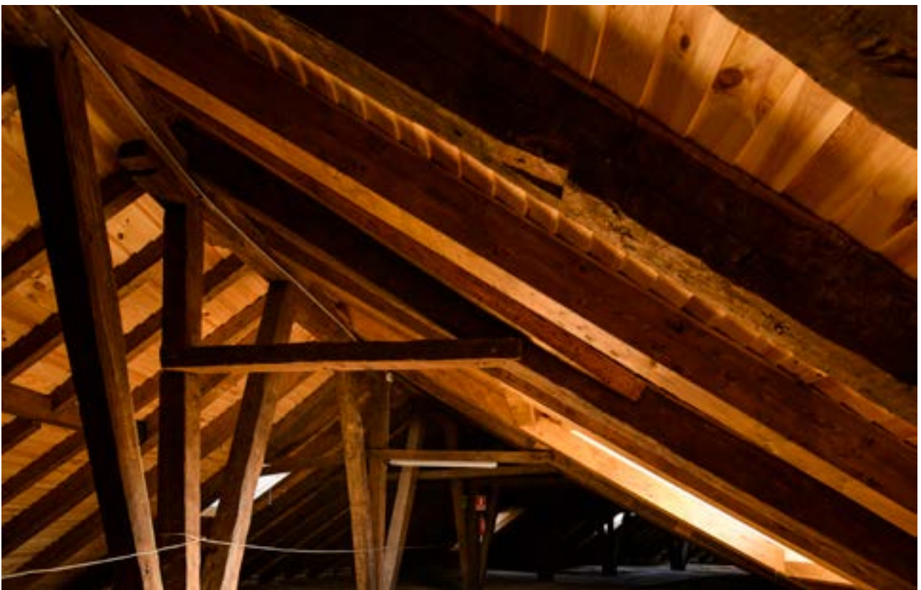
Restored roof structure | Estructura de cubierta restaurada | Estrutura da cobertura restaurada (Joaquín Zamora)

escombros. Por este motivo, os trabalhos realizados basearam-se na reconstrução e não na demolição, para além do emprego dos mesmos sistemas construtivos e materiais tradicionais encontrados no edifício e da incorporação dos restos arqueológicos que apareceram durante as obras, pois também formam parte da história do edifício.