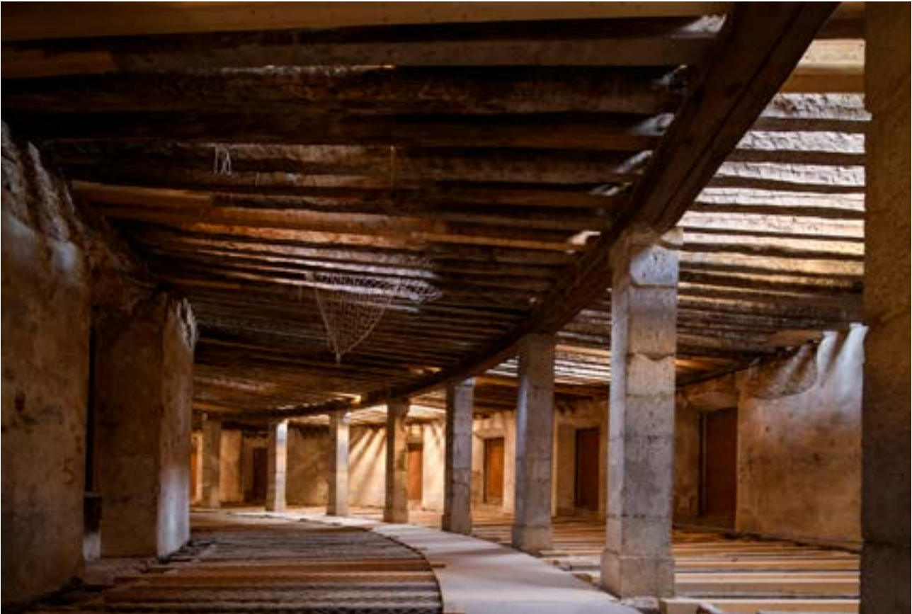
State of conservation of the interior of the first floor before the intervention | Estado de conservación del interior de la primera planta previo a la intervención | Estado de conservação do interior da planta primeira antes da intervenção

in order to undertake an integral conservation, and the functional revitalization and enhancement of the building to be enjoyed as a Heritage Asset by the inhabitants of the town and all its visitors.