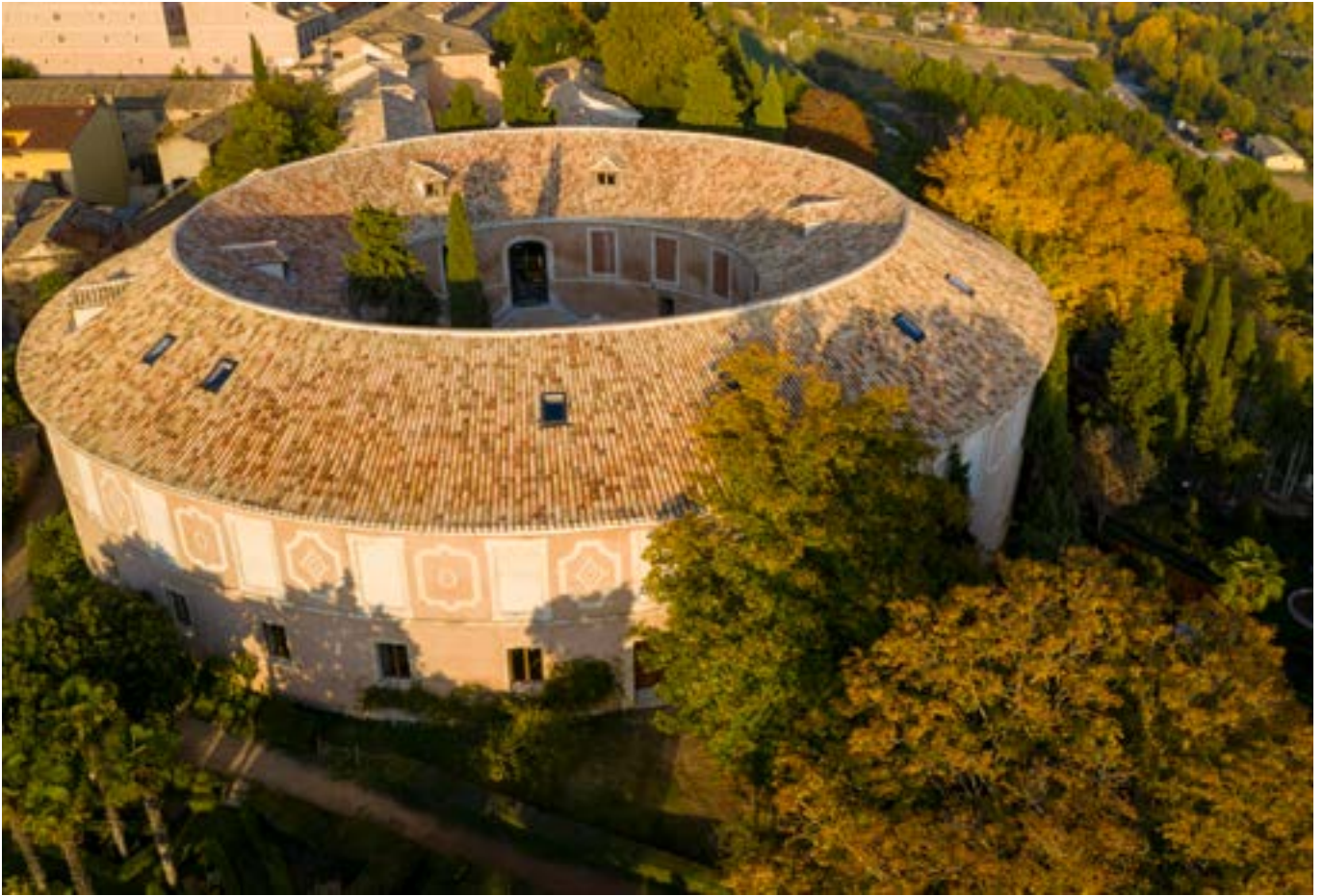
The Rotonda building after its restoration | Edificio de la Rotonda tras las obras de restauración | Edifício da Rotonda após as obras de restauração (Joaquín Zamora)

Finally, the crisis that struck at the turn of the century brought about a decrease in industrial activity. During the Spanish Independence War, the production of the Factory stopped and started its gradual decline until it was completely abandoned. During its long life, this singular industrial building was the subject of numerous interventions and maintenance works; the latest on record, previous to the one mentioned in this article, was commissioned in 1982 by the Dirección General de Bellas Artes to architects M a Carmen Mostaza and Andrés Perea, with the purpose of restoring the Rotonda buildings and the chapel. Even though the structure was consolidated and the roofs and façades were repaired, the proposed rehabilitation of the interior of the building was not carried out.