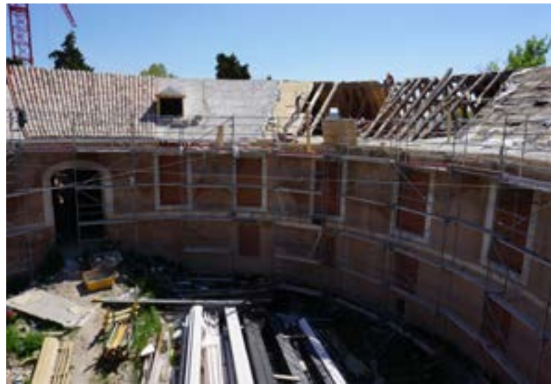
1: Removal of the concrete slab which was presumably added during the works carried out in the 80's 2: Image of the restoration of the Rotonda roof, showing the sequence of the works carried out, from the removal of the concrete slab and the timber remains (right) to the final retiling (left) | 1: Retirada de la losa de hormigón ejecutada presumiblemente durante el transcurso de las obras llevadas a cabo en la década de los años ochenta 2: Imagen de la restauración de la cubierta de la rotonda, donde se aprecia la secuencia de los trabajos realizados, desde la retirada de la losa de hormigón y restos de tabla (derecha) hasta el retejado final (izquierda) | 1: Retirada da laje de betão executada supostamente durante o decorrer das obras efetuadas na década dos anos oitenta 2: Imagem da restauração da cobertura da Rotonda, onde se aprecia a sequência dos trabalhos realizados, desde a retirada da laje de betão e restos de tábuas (direita) até ao retelhado final (esquerda)

The existing roof was a gable roof with ceramic tiles. Due to the previous interventions, the tiles stood on a reinforced concrete slab that generated excessive load on the load-bearing timber structure, as well as the inappropriate stiffening of the whole constructive system. Numerous timber beams had collapsed as a result of the introduction of this system. This led to the complete disappearance of some areas of the roof that let water come in, seriously damaging the interior of the building.