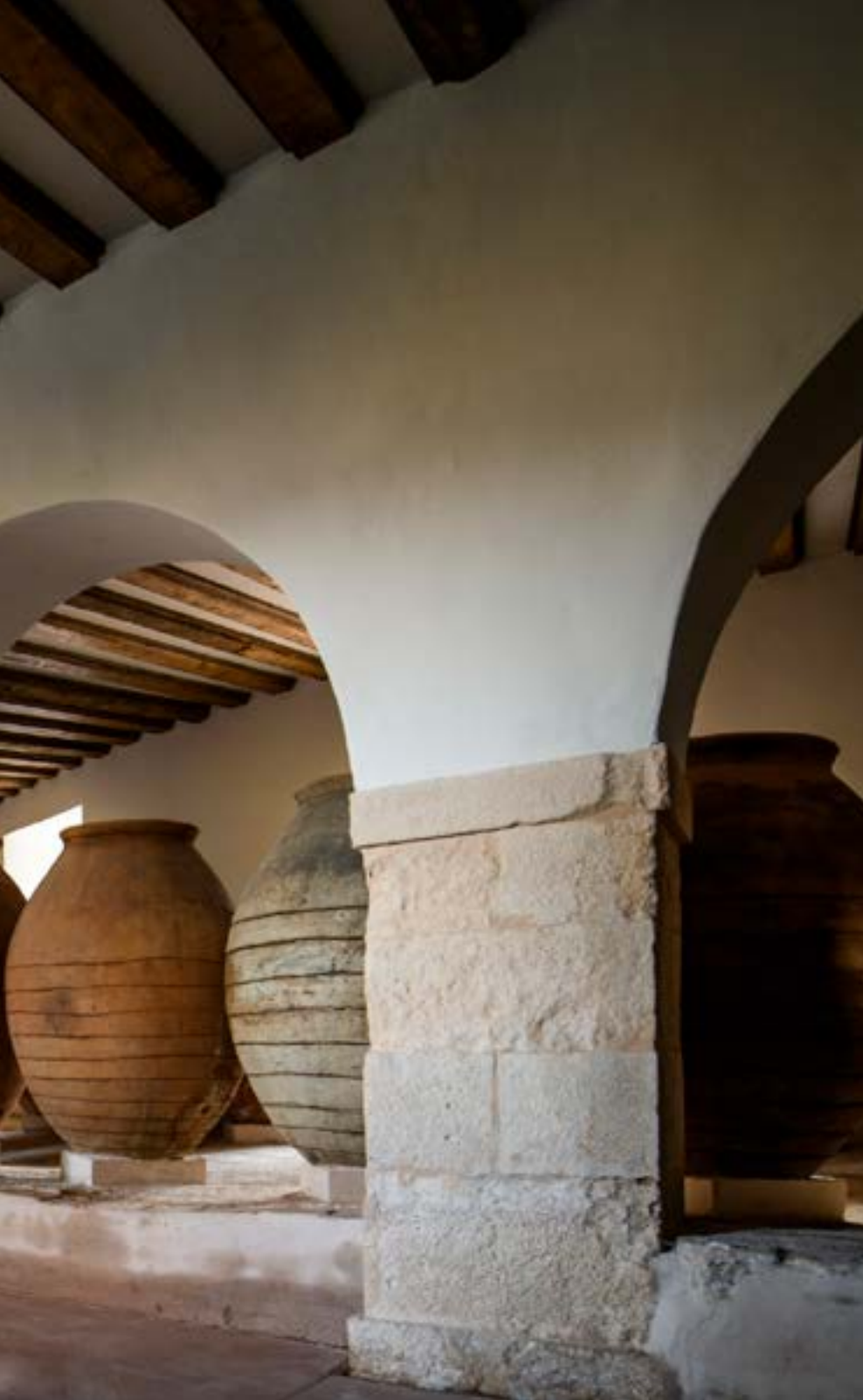
Interior space of the Rotonda after restoration | Espacio interior de la Rotonda tras las obras de restauración | Espaço interior da Rotonda após as obras de restauração (Joaquín Zamora)

los de Belmonte (Cuenca), Brihuega (Guadalajara), Caravaca de la Cruz (Murcia), Alcalá de Henares (Madrid), Teguiuse (Lanzarote) o Tabernas (Almería). Ha recibido el Premio Europa Nostra 2016 por sus actuaciones en las iglesias de Lorca tras los terremotos de 2011, el Premio de restauración de la Unión Europea por su intervención en la Catedral de Alcalá de Henares, el Premio a la Calidad en la Edificación de la Región de Murcia por el Museo de Bellas Artes de Murcia, el Premio de Cultura de la Comunidad de Madrid (2016) por su trayectoria profesional en la especialidad de Patrimonio Histórico, y el Premio Rafael Manzano de Nueva Arquitectura Tradicional (2018) también por el conjunto de su obra.