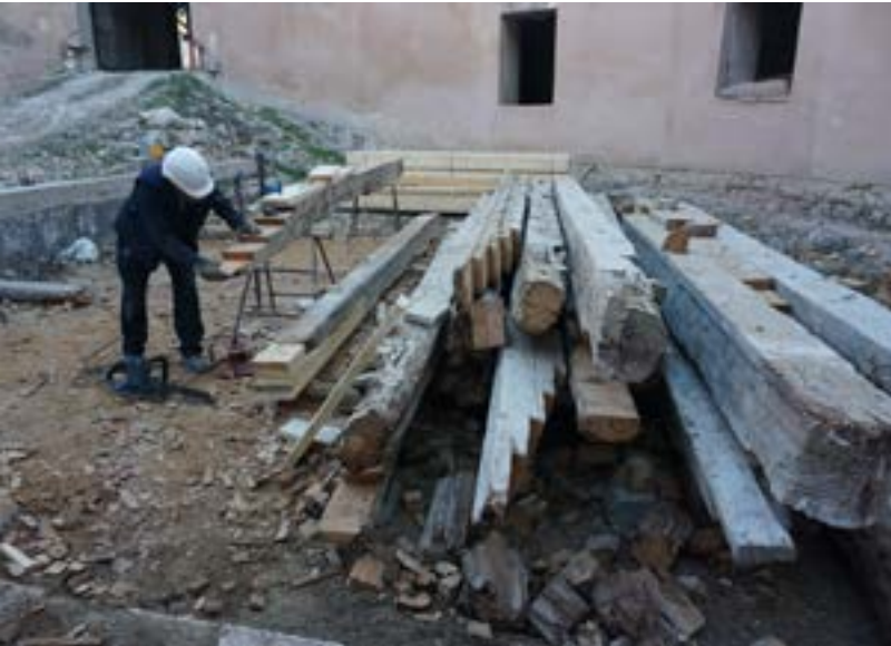
Recovery of the profiles on the deteriorated timber beams | Ejecución de las prótesis en las vigas de madera deterioradas | Execução das próteses nas vigas de madeira deterioradas