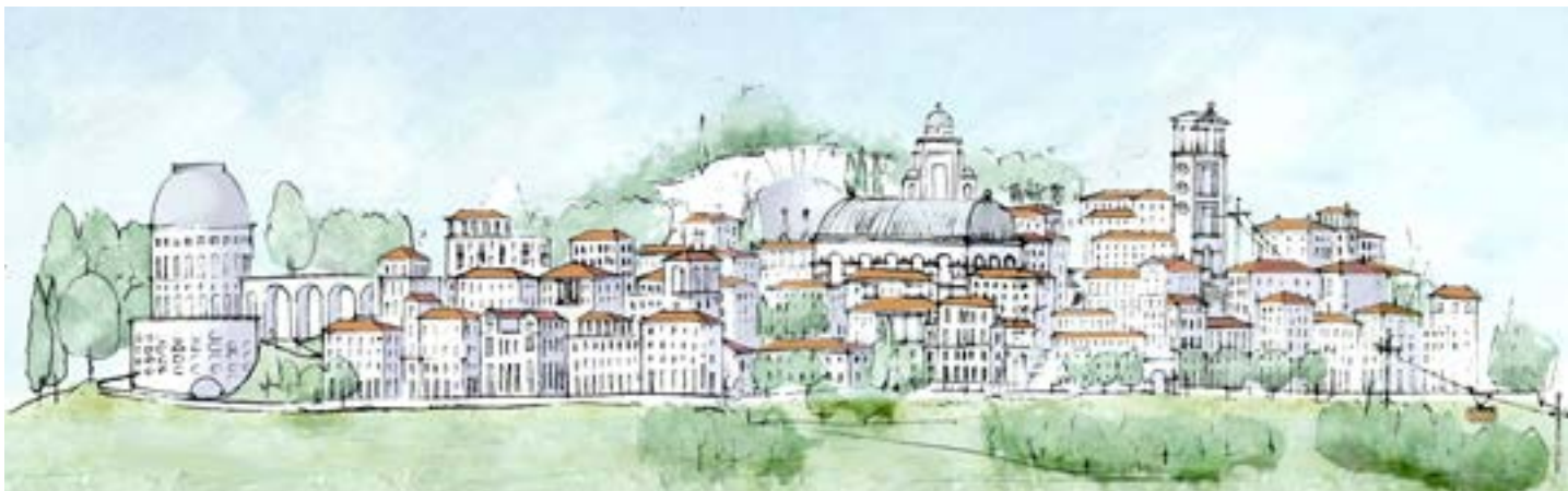
El Socorro Alto and Bajo elevation view | Alzado de El Socorro Alto y Bajo | Alçado de El Socorro Alto y Bajo (Estudio Urbano)

É consultor de Arquitectura e Urbanismo e designer; autor e professor. Nasceu em 1946 na cidade do Luxemburgo. Estudou na Universidade de Estugarda de 1967 a 68 e trabalhou com James Stirling de 1968 a 1974. Leon Krier é um teórico que promove a racionalidade tecnológica, ecológica e social e a modernidade do urbanismo e da arquitectura tradicional, resumida no seu livro The Architecture of Community (Island Press, 2009) e na sua edição Espanhola alargada La arquitectura de la comunidad: La modernidad tradicional y la ecología del urbanismo (Editorial Reverté, 2013). Desde 1988, é responsável pelo plano director da Nova Cidade de Poundbury para O Príncipe de Gales; desde 2003, Cayalá, na Guatemala; desde 2015 e 2020 os projectos El Socorro e Nogales, também na Guatemala; e desde 2018 a Nova Cidade de Herencia de Allende, em Guanajuato, México. Leccionou em várias escolas de arquitectura e é Professor Convidado na Escola de Arquitectura de Yale, tendo-lhe sido atribuída a honra Britânica de Comandante da Ordem Real Vitoriana, a Medalha de Prata da Académie Française em 1997, o Prémio Athena do Congress for the New Urbanism em 2006, e foi o primeiro galardoado com o Prémio Richard H. Driehaus em 2003. Desde 1990, desenha também para a Giorgetti e Valli-Valli.