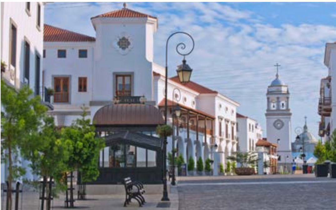
Main street at Paseo Cayalá with underground parking pavilion in the foreground, 2016 | Calle principal de Paseo Cayalá con el pabellón de acceso al parking subterráneo, 2016 | Rua principal de Paseo Cayalá com o pavilhão de acesso ao parque de estacionamento subterráneo, 2016 (Waseem Syed)

Os edifícios cívicos adaptam as formas e princípios clássicos das perenes línguas arquitectónicas Maia e Espanhola da Guatemala. Uma escala cívica consistente, o uso de um vocabulário arquitectónico