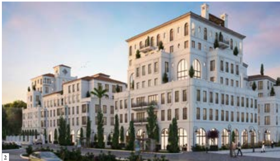
1: Urban squares at Lirios, 2020 2: High rise mixed use buildings at Lirios | 1: Manzanas urbanas en Lirios 2: Edificios de uso mixto de gran altura en Lirios | 1: Quarteirões urbanos em Lirios 2. Edifícios de uso misto de grande altura em Lirios (1: Rudy Pineda 2: Estudio Urbano)