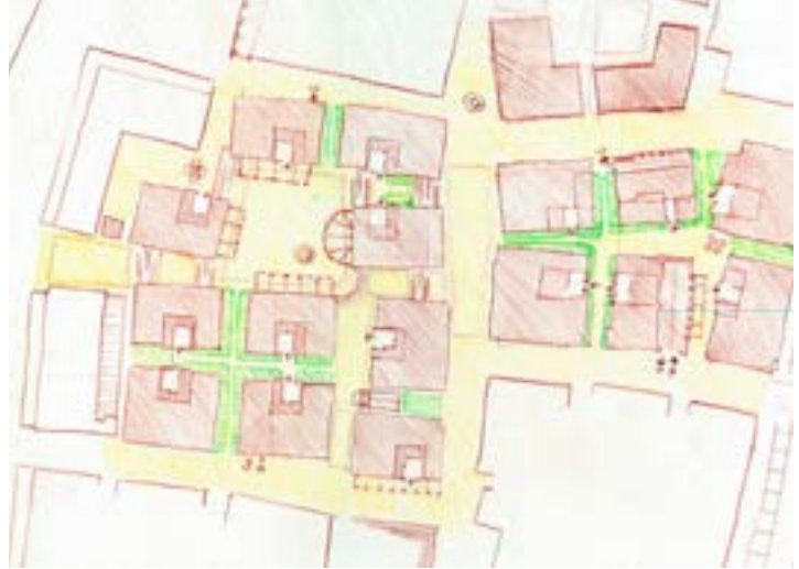
Block design for an enclave in Distrito Moda, part of the quartiere of Paseo Cayalá | Diseño de una manzana para el Distrito Moda, parte del barrio de Paseo Cayalá | Desenho de um quarteirão para o Distrito Moda, parte do bairro de Paseo Cayalá (Estudio Urbano)