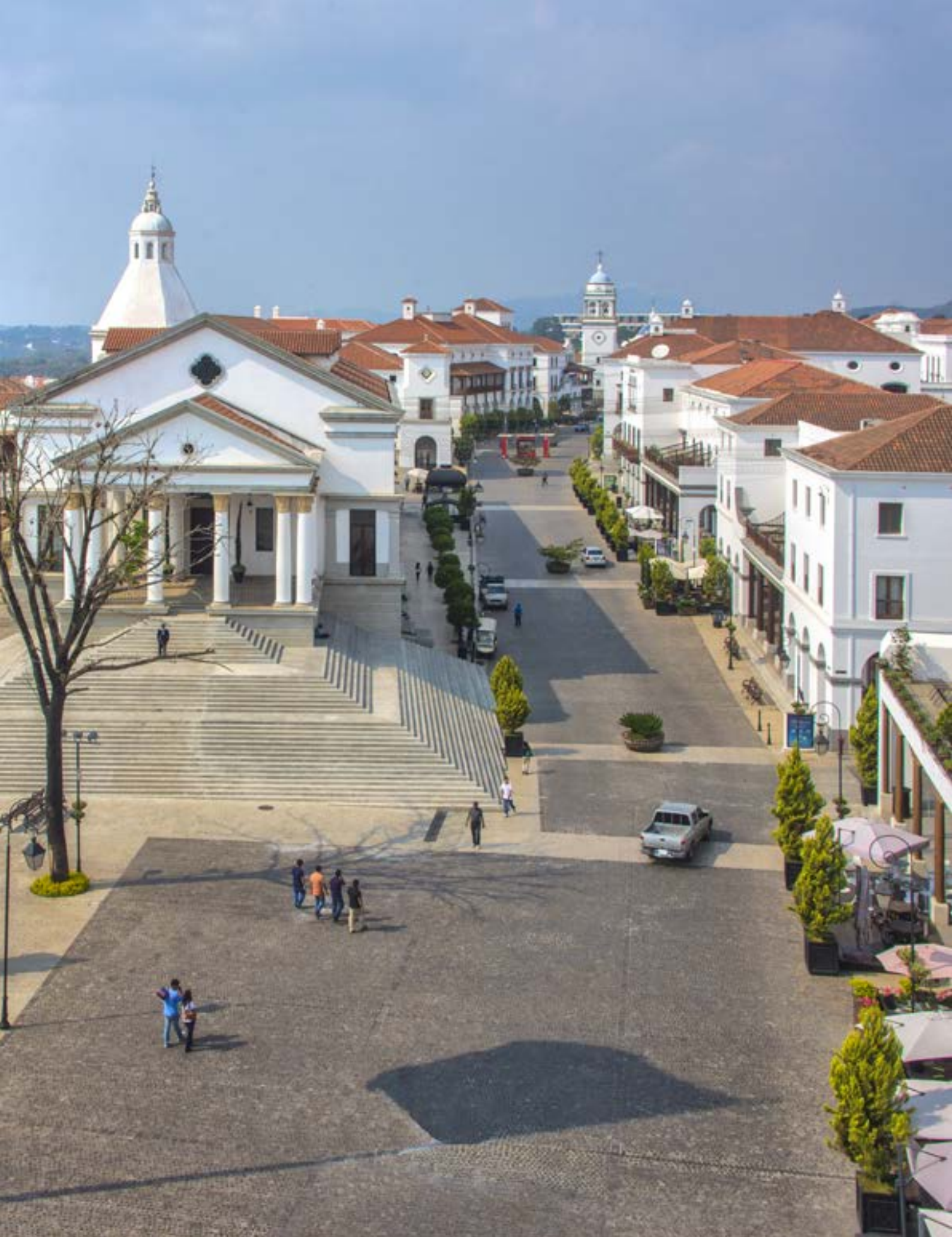
Main Street at Paseo Cayalá Neighborhood, with Azarias Civic Hall and the church campanile in the back | Calle principal en el Barrio Paseo Cayalá, con el Centro Cívico Azarias y el campanario de la iglesia al fondo | Rua principal no Bairro Paseo Cayalá, com o Centro Cívico Azarias e o campanário da igreja ao fundo (Waseem Syed)