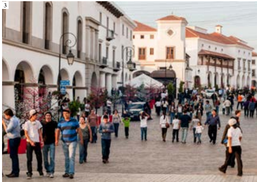
1: Master Plan of Ciudad Cayalá with defined urban quarters 2: Paseo Cayalá surrounded by ravines and nature 3: Busy Main Street at Paseo Cayalá Neighborhood | 1: Plan director de Ciudad Cayalá 2: Paseo Cayalá rodeado de barrancos y naturaleza 3: La concurrida calle principal de Paseo Cayalá | 1: Plano principal da Cidade Cayalá 2: Paseo Cayalá rodeado de barrancos e natureza 3: A concorrida rua principal de Paseo Cayalá (1: Estudio Urbano 2: Carmen Maldonado 3: Grupo Cayalá)

The first phase of Cayalá’s masterplan broke ground in 2009 with the construction of Paseo Cayalá. This new urban quarter is designed around four principal streets converging on a main square. These connect to a public promenade that offers breathtaking views of Guatemala City’s skyline and volcanic peaks on the horizon. The quarter consists of several neighborhoods: these are the commercial center, Ramblas, Nova, Belesa, Olmos, and Lirios.