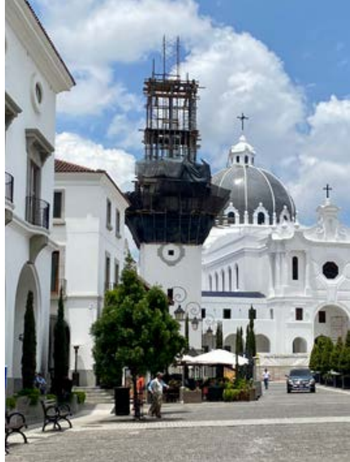
Church of Santa Maria Reina de la Familia, 2021 | Iglesia de Santa María Reina de la Familia, 2021 | Igreja de Santa Maria Rainha da Família, 2021 (Estudio Urbano)

public edifices –e.g. the Azaria Hall by Richard Economakis, the Market Tower by Leon Krier, and the Church of Santa Maria Reina de la Familia by Pedro Godoy and Maria Sanchez of Estudio Urbano– to stand out against the surrounding buildings, and serve as visual points of reference. Although entrusted to different architects, these buildings are designed to be good architectural neighbors; they represent variety within unity and symbolize a hopeful, collaborative society.