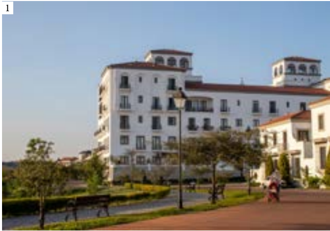
1: Variety of housing typologies: single-family town houses in the front, with a multi-family complex in the back, surrounded by green, walkable streets, 2021 2: Street view at Ramblas, 2019 3: Town house facade compositions facing the neighborhood park at Ramblas, 2019 | 1: Variedad de tipos de vivienda: casas unifamiliares en el frente, con un edificio plurifamiliar en la parte trasera, rodeado de calles verdes y caminables, 2021 2: Vista de la calle en las Ramblas, 2019 3: Composiciones de fachadas de casas frente al parque del barrio en las Ramblas, 2019 | 1: Vários tipos de vivenda: casas unifamiliares em frente, com um edifício plurifamiliar nas traseiras, rodeado de ruas verdes e caminhável, 2021 2: Vista da rua nas Ramblas, 2019 3: Composição de fachadas de casas em frente ao parque do bairro nas Ramblas, 2019

Fazendo parte de Paseo Cayalá, o Estudio Urbano foi encarregado de projectar os edifícios dos bairros residenciais de Ramblas, Nova, Belesa, e Olmos. Estas áreas, que incluem um conjunto de opções habitacionais e parques paisagísticos atractivos, foram concluídas entre 2014 e 2019. Os edifícios, construídos numa escala mais íntima, são casas familiares de piso único, ou de dois ou três andares, vivendas, condomínios geminados multifamiliares, e apartamentos que estão dispostos de forma a constituir