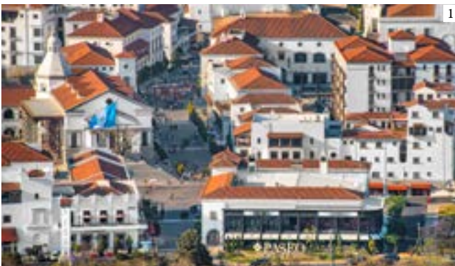
1: Main Street at Paseo Cayalá Neighborhood looking north, 2016 2: Cinema and Main Square at Paseo Cayalá Neighborhood, 2019 | 1: Calle principal en Paseo Cayalá. Vista hacia el norte, 2016 2: Cine y Plaza Mayor en Paseo Cayalá, 2019 | 1: Rua principal em Paseo Cayalá. Vista orientada a norte, 2016 2: Cinema e Plaza Mayor em Paseo Cayalá, 2019 (1: Waseem Syed 2: Carmen Maldonado)

Os edifícios e espaços públicos são cuidadosamente integrados e interligados para promover a interação social e reforçar o sentido de comunidade entre os residentes e visitantes. A intenção foi a de criar um lugar bonito e seguro para os habitantes da Guatemala visitarem e desfrutarem nas gerações futuras.